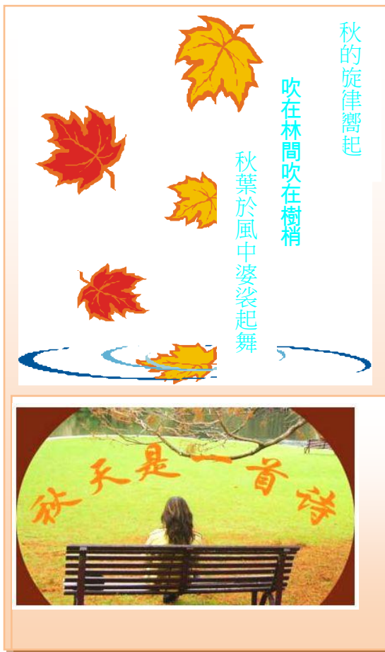
105 年 11 月 行 事 曆