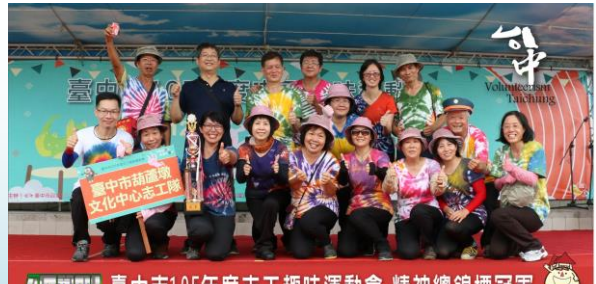
臺中市105年度志工趣味運動會-精神總錦標冠軍 日期：105年8月27日(星期六) / 地點：大里區運動公園 / 主辦單位：臺中市政府社會局