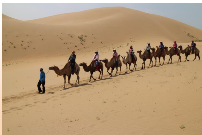
中國內蒙古自治區庫布齊沙漠