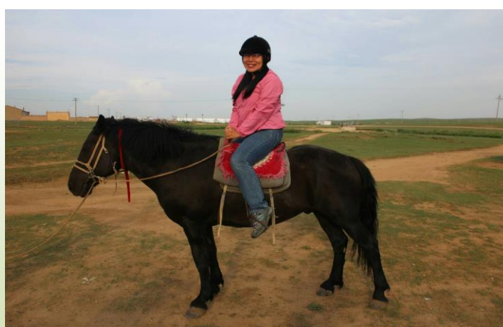
中國內蒙古自治區希拉穆仁大草原