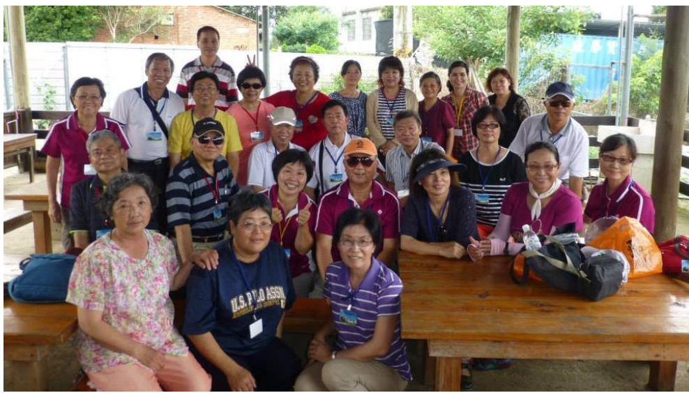
104年6月14日大聯誼 麥克田園休閒